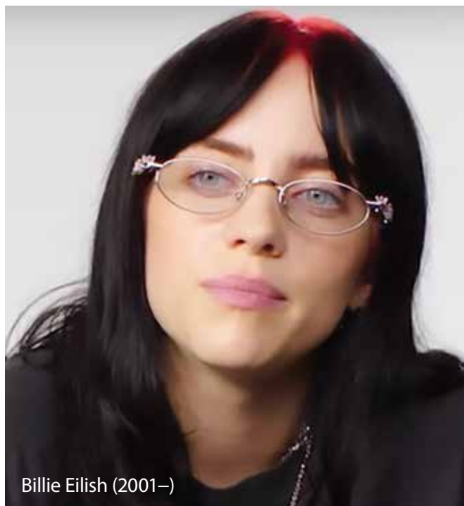
Billie Eilish (2001–)