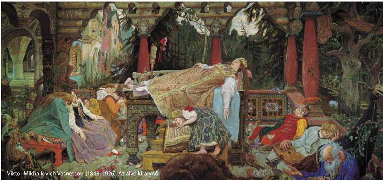
Viktor Mikhailovich Vasnetsov (1848–1926): Az alvó királynő

Ezzel szemben Csipkerózsika története akár egy teljes tüdőgyógyászati alvásélettani tankönyvfejezettel is felér. Ígéretes már az angol cím is: Sleeping Beauty . A történet – legalábbis a Grimm szerinti erősen finomí-