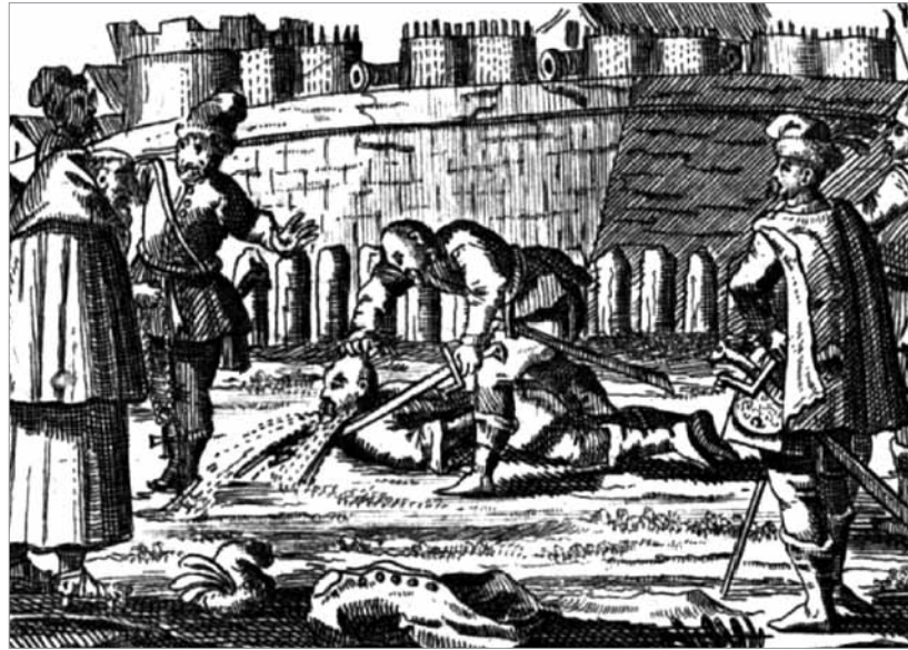
Ocskay lefejezése (korabeli fametszet)

Az elektromos cigaretta 2014-ben vezette a sajtóbeli megjelenés gyakorisági listáját.