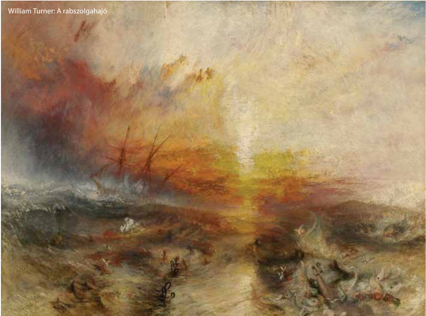
William Turner: A rabszolgahajó

sen pedig az Alpeseig terjedő légköri katasztrófa követett. A kor a természettudomány kibontakozásáé, a statisztikai adatgyűjtés kezdetéé, legyen szó a meteorológiai jelenségekről vagy a halálozási mutatókról. Az epidemiológiai számítások szórása nagy, de Nagy-Britanniában 100 000 körülre teszik a vulkáni hamu, füst számlájára írható „idő előtti halálozást”. Az angol ipari forradalom derekán járunk – az additív hatás szétszálazása reménytelen vállalkozás; a tudatlanság szmogja burkolja be a múltat. (Kedves pourtamenteau: smoke: füst; fog: köd > smog / szmog)