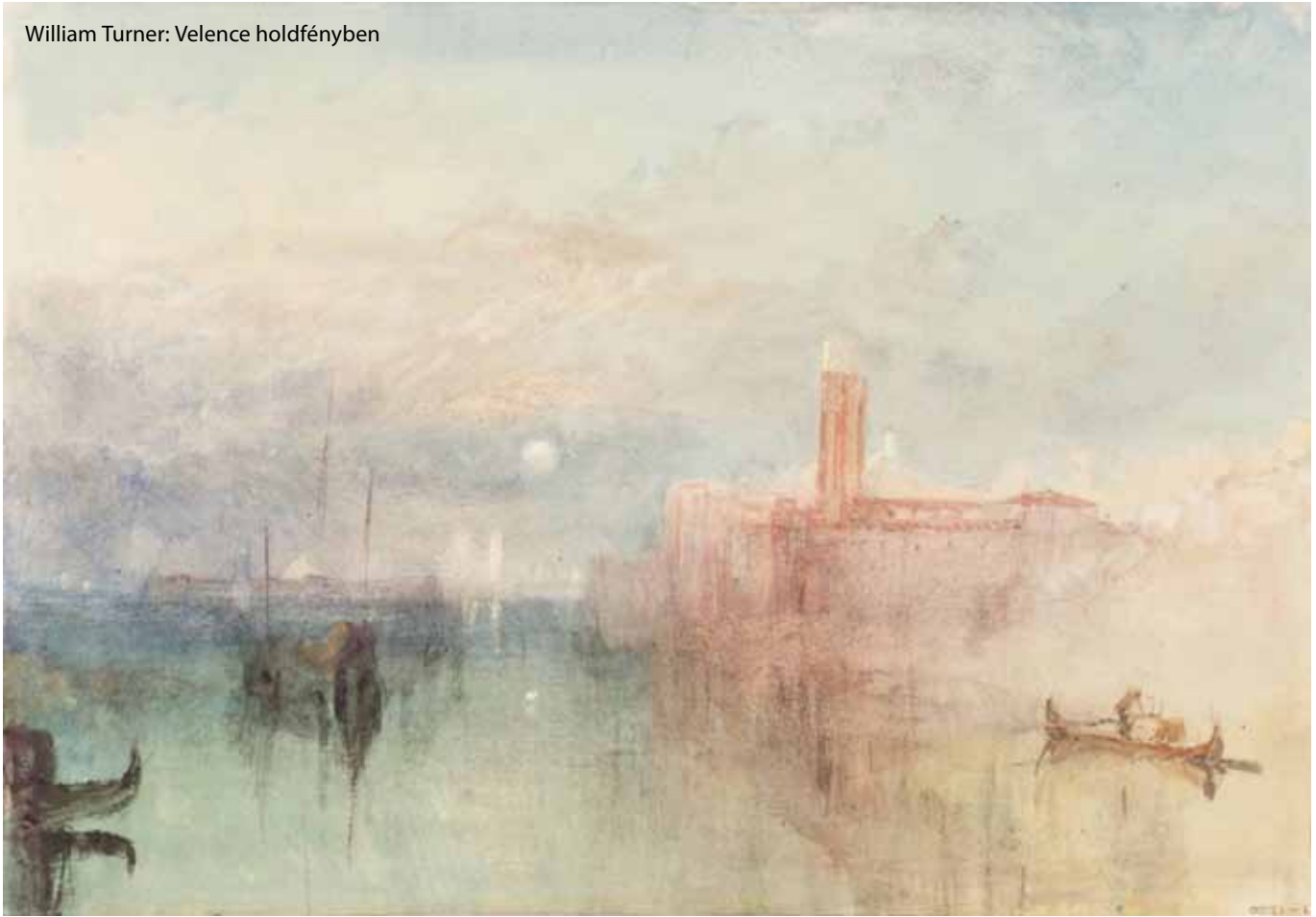
William Turner: Velence holdfényben