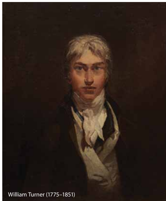
William Turner (1775–1851)

Bár az Amega szerkesztősége, mint haladó és nyitott fórum, itt sajnos még nem tart; a karácsonyi készülődés áhítatos izgalmából nem engedünk. Mivel kvalitásos képet hiába is kérnénk a Jézuskától, a festészet világában tett sétával kárpótoljuk a Kedves Olvasót.