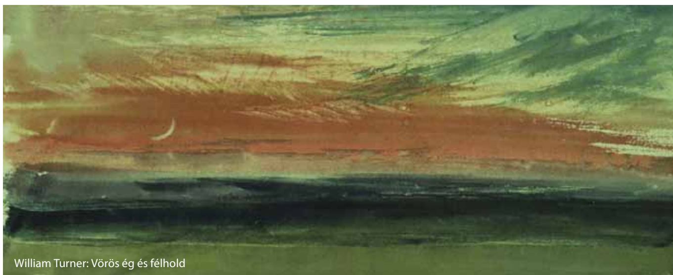
William Turner: Vörös ég és félhold

Turner hűgának hirtelen halála az izlandi Laki vulkán azévi júniusi kitörése utánra következett, melyet hónapokig elhúzódó, a brit szigetek fölötti, a kontinen-