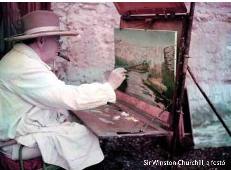
Sir Winston Churchill, a festő