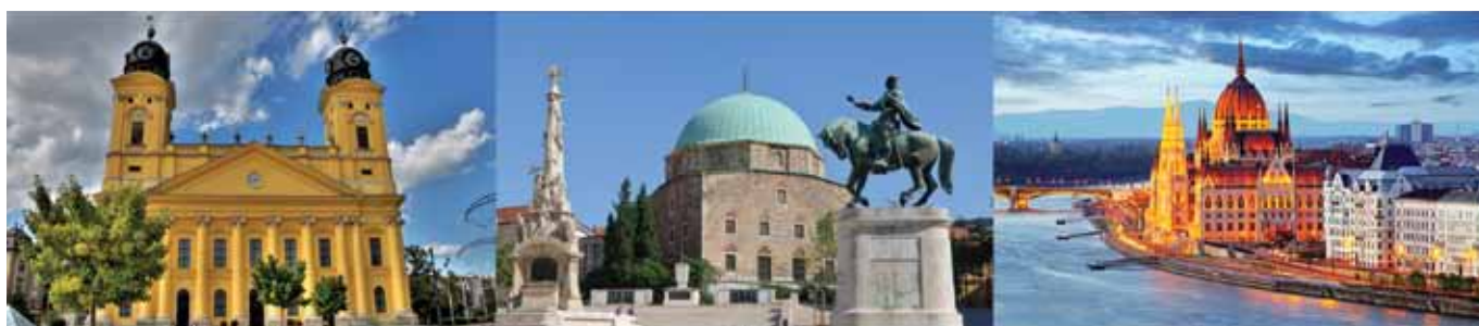
DEBRECEN 2022. január 28-29.