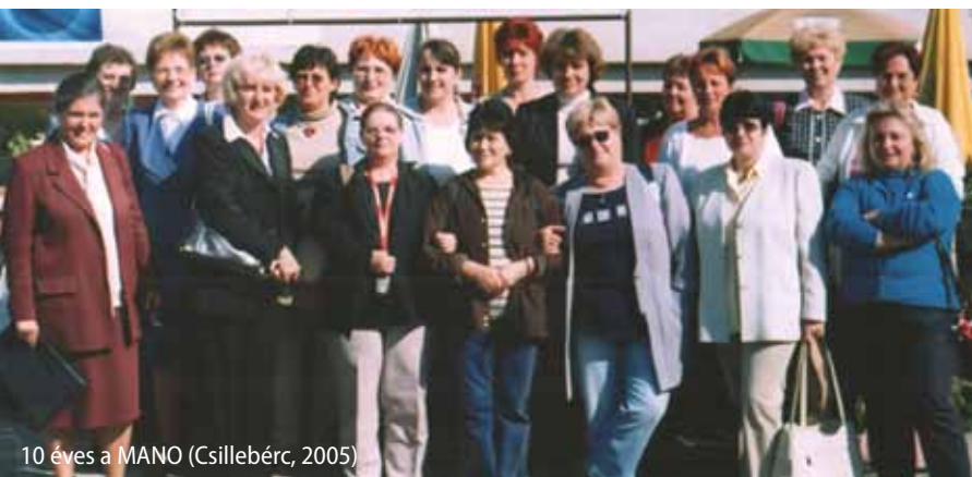
10 éves a MANO (Csillebérc, 2005)

Az egyesület nonprofit szervezetként működik, a Nyíregyházi Törvényszék a Pk. 60187/1995/11 szám alatt jegyezte be, 1998. január 1-től közhasznú társadalmi szervezetnek minősül. Az egészségügyről szóló 1997. évi. CLIV. törvényben meghatározott egészségmegőrző, betegségmegelőző, gyógyító és rehabilitációs tevékenységeket végez. Pontszerző országos szakmai továbbképzések szervezésével, kongresszusokon való részvétel támogatásával, folyóirat postázásával az aktuális szakmai ismeretanyagot továbbítja a tagság felé. Bevételei a tagdíjakból, a cégek támogatásából és a felajánlott személyi jövedelemadó 1%-ából tevődnek össze.