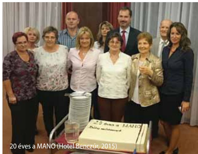
20 éves a MANO (Hotel Benczúr, 2015)