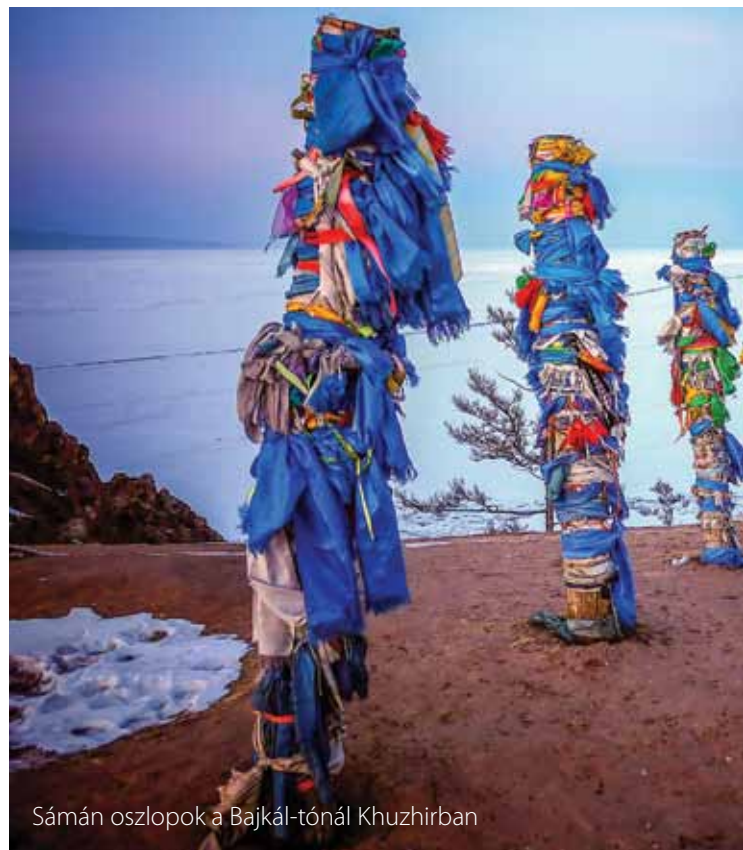
Sámán oszlopok a Bajkál-tónál Khuzhirban

Hoppál Mihály néprajzkutató szerint a sámánizmus olyan hiedelemrendszer, amely magában foglalja a tudást az istenekről, a hitet az istenekben és a korábbi sámánok segítő szellemeiben. Ez utóbbiaktól örökölték a tevékenységüket kísérő bizonyos szövegek emlékét, a rítusok szabályait és a tárgyakat, eszközöket,