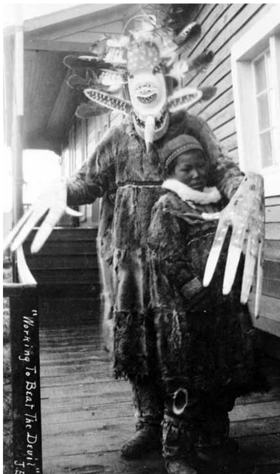
Jupik sámán gonosz szellemet űz ki egy beteg fiúból

ruháznak rá. Át kell vennie a növények és állatok tulajdonságait is, ezt jelképezik a ruhájukra aggatott levelek, termékek, illetve bőrruhák, tollak, fejdíszek. Beavatása után a sámán a feladatát a természetfeletti lényekkel való tetszés szerinti és közvetlen érintkezés alapján látja el. Akkor teremtheti meg a szellemekkel a kapcsolatot, amikor az számára szükséges, nem kell valami médiumszerű közvetítőt közbeiktatnia.