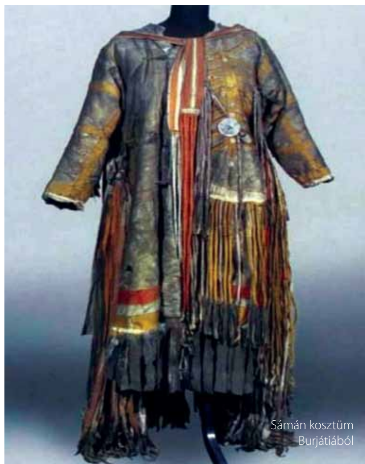
Sámán kosztüm Burjátiából