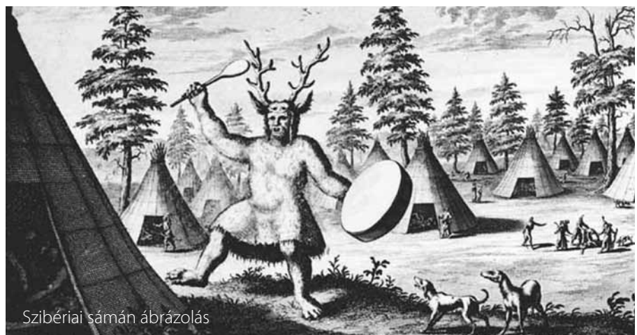
Szibériai sámán ábrázolás

getésekkel csábítja, ha így sem ér célt, kínozza a kiválasztottat. Ez az ún. „sámánbetegség” hónapokon, esetleg éveken át gyötri, vagyis mindaddig, amíg el nem fogadja a kényszerű hivatást. Ha a jelölt engedett a kényszernek és sámán lett, akkor huzamosabb ideig aludt egyfolytában (három, hét vagy háromszor három napig). A huzamos alvás idején a szellemek a jelöltet feldarabolják, és átszámolják a csontjait, tehát ellenőrzik, valóban rendelkezik-e a sámánsághoz szükséges rendellenességgel. Ha igen, sámánná vált. A beavatószerzés során a jelöltnek (az ég lakóinak való bemutatkozás céljából) magas fát (életfa) vagy létrát, egyes népeknél magas hegyet kell megmásznia. A legmagasabb ponton a szellemekkel találkozik, hozzájuk imádkozik, és ott kapja meg a saját segítő szellemét, amit nem ő választ ki, hanem az adott szellem szegődik hozzá. Az életfa jelkép: gyökere az alsó világba hatol, csúcsa a felső világba ér, törzse a középső világban van, a mindennapi, racionális emberi világban. Az avatandót a többi sámán vérrel „tisztítja meg”, amivel további számos tulajdonságot