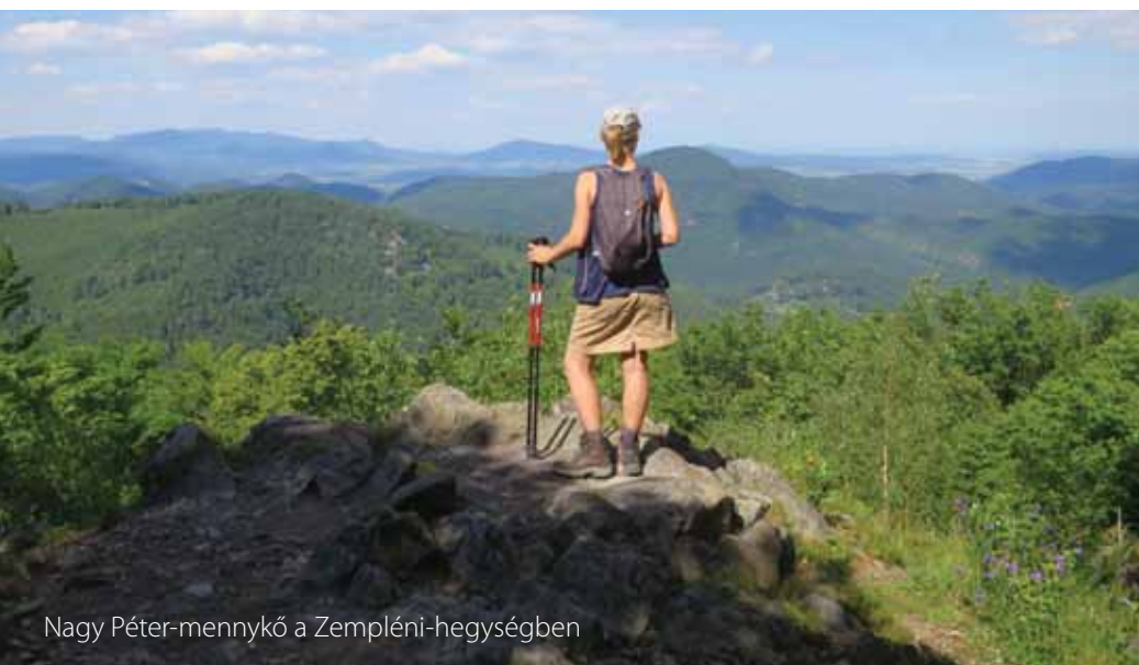
Nagy Péter-mennykő a Zempléni-hegységben

Oláh Andor: „Új hold, újkirály” – A magyar népi orvoslás életrajza. Gondolat Kiadó, 1986. Vajkai Aurél: Népi gyógyászat. Jó szöveg Kiadó, 2003. A Google és a Wikipedia megfelelő címszavai