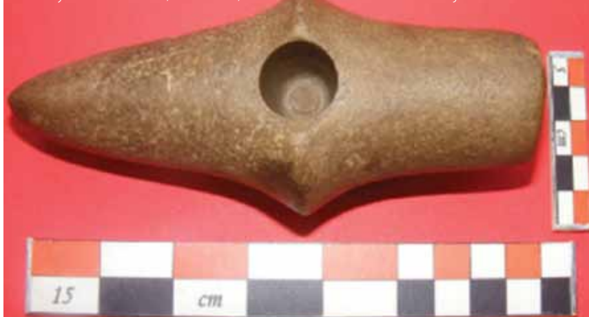
Mennykőként tisztelt, elrontott, részben kifűrt kőbalta Kántorjánosiból

része: „Vagyon olyan nyavalyájok is a gyermekeknek, melyben eleget szopnak, esznek, de még is semmi látattya rajtok nincsen, hanem elszáradnak, erőtlenednek, fognak naponként. Ezt a Magyarok néha Eb Agjának híják. E nyavalya pedig esik a bőr alatt termő szőr-féregtől, mely, mint a szőr-szál, olyan vékony, külömben nem is láthatni meg, hanem a feredőben. E férgek szívják el a tápláló nedvességet (...)” Az ebagos gyereket az egyik gyógymód szerint háromszor a (hideg) kemencébe vetik, vagy más formában végeznek kemencével kapcsolatos gyógyítási aktust. A kemence – éppúgy, mint a szabad kémény – ugyanis széljárta hely, a kemencébe vetés azt jelenti, hogy átadják a kutyaugatás rossz szelét, szelletét a kinti szélnek, hagyja el a gyermeket. Előfordult, hogy olyan vízben fürdetik az ebagos gyereket, amiben előbb kutyafejet főztek, és utána „felkötik valahová” a kifőzött kutyafejet. Mivel ugató kutytól ered a betegség, azért jó ez a fürdő és a fára kötés (áldozat motívum).