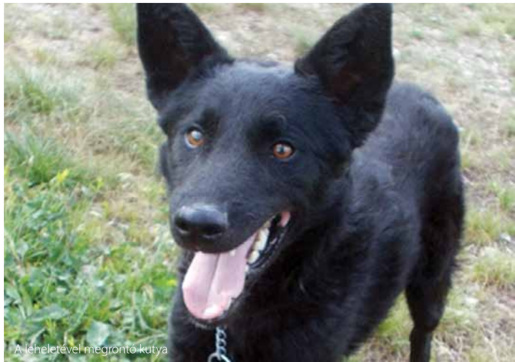
A léheletével megrontó kutya

az ilyen gyerek szőrösebb, mint a társai: „olyan szőrös, mint a kutya”. „Olyan száraz, sovány. Hiába adnak neki enni, nem veszi magát, hústalan.” A beteg „aggik, agg” (töpörödik, megy össze). Az ilyen gyerek ebagos , a szőrőféreg megrontotta a vérét. A gyerek az ebagot az anyjától kapja. „Az anyja, mikor hordozta, kutyaéhoz rugdosott, és a kutya visszaugatott rá.” A rúgással felingerelt kutya száját tátja rá, dühös, rossz párját, szelletét ugatással rábocsájtja. Ez a szellet hatol az anyába, és rontja meg a magzatot. (Talán az „ebugatta” szó eredete is innen való.) „Nem szabad a terhesnek kutyaéhoz, macskához rúgni, mert ebagos lesz a gyermek, a szőr annyit nő befelé, mint kifelé, amíg végül megöli a gyermeket.” Szép példája a professzionális és népi gyógyászat elemeinek a hivatalos orvoslásba való be- szivárgásának Pápai Páriz Ferenc Pax Corporis ának ide vonatkozó