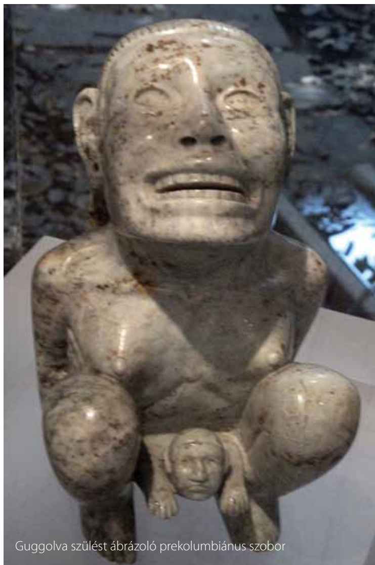
Guggolva szülést ábrázoló prekolumbiánus szobor