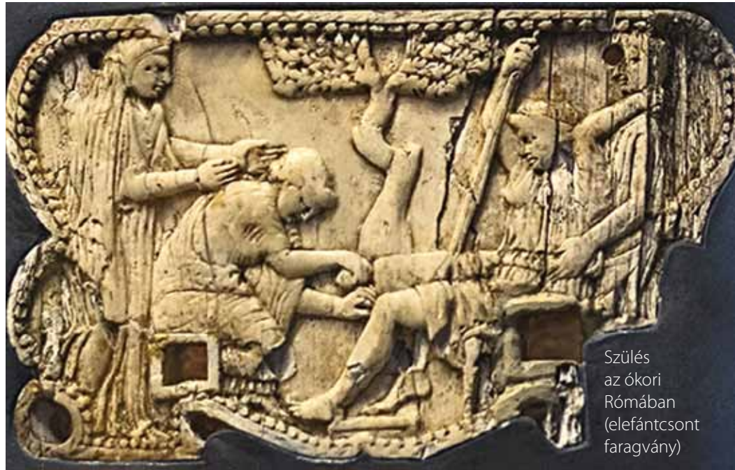
Szülés az ókori Rómában (elefántcsont faragvány)

A méhlepény számos mágikus cselekedet eszközéül szolgált: bedörzsölték vele az anya arcát, hogy elmúljanak a májfoltjai vagy a csecsemőt az anyajegyei ellen. A méhlepényt általában elásták, például egy gyümölcsfa tövébe, így biztosítva annak termékenységét, vagy egy nehezen hozzáférhető helyre, hogy ne lehessen az anyát vagy az újszülöttet megrontani vele. Bali szigetén a hiedelem szerint a placentának saját szelleme vagy lelke van, és ez védi meg a gyermeket a későbbiekben, akár egy védőangyal. A szülők éppen ezért egy különleges temetőben temetik el a méhlepényt szülés után. A placenta elfogyasztását különösen a kínai, jamaicai és indiai orvoslás egyes ágazatai ajánlják, de a placentaevés világszerte elter-