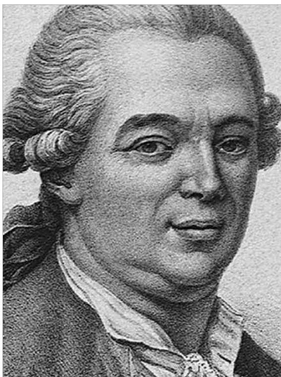
Franz Anton Mesmer (1734–1815)

orvosa mágneset helyezett különböző testtájaira. A páciens ekkor olyan érzetről számolt be, mintha valamilyen rejtélyes folyadék áramlana végig a testén, és a kezelést követően órákra megszabadult tüneteitől. Mesmer a gyógyulás okát nem csak a mágnesben látta, hanem a kezelés során általa felhalmozott „magnétisme animal”-ben. Később a mágnes közvetlen szerepét már tagadta, és egyedül a magnetizőr személyiségéből áradó fluidumnak tulajdonított jelentőséget. Ő az, aki a magnetikus fluidumot összegyűjti és kisugározza. A kezelések során szemben foglalt helyet a pácienssel úgy, hogy térdei annak térdeit érték, kezeivel a beteg hüvelykujjaira gyakorolt nyomást, szemeivel