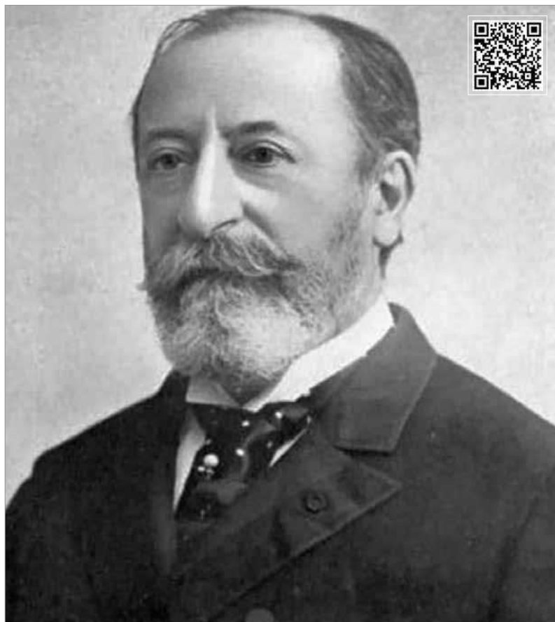
Camille Saint-Saëns (1835–1921)

10. tétel: A madárház (3:20). Míg a háttérben a vonósok a dzsungel rejtélyes hangjait szolgáltatják, a fuvola különböző madárhangokat jelenít meg.