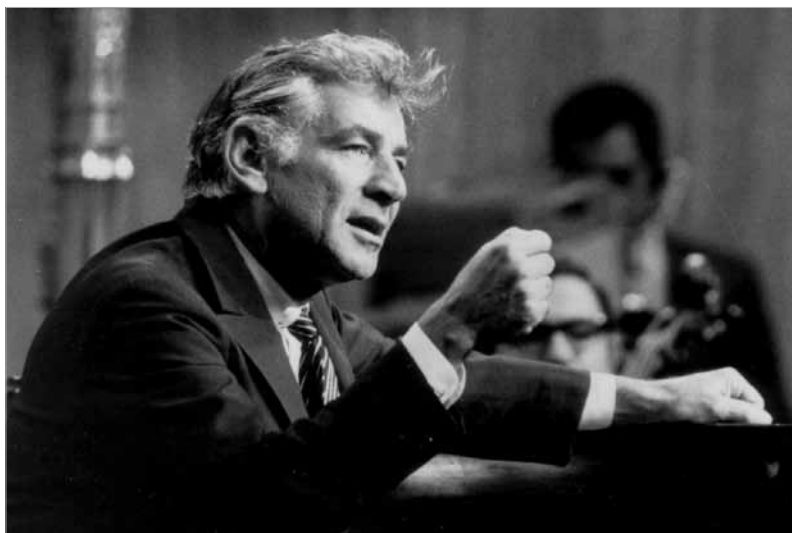
Leonard Bernstein (1918–1990)

így. Nem érez szédülést. Milyen kicsi lábai vannak! Volna kedve vizsztatérni a mellkasomba?" (részlet a „Sportok és szórakozások”-ból). Művei között nagy számban vannak gymnopediának nevezett zongoradarabok.