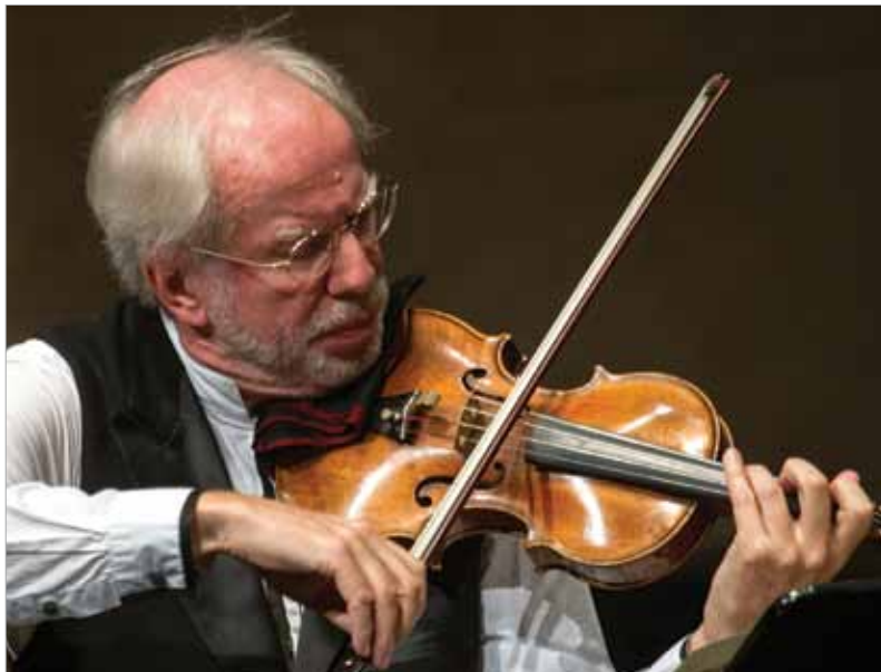
Gidon Kremer (1947–)

variációt (7:12) a fafúvósok adják elő, a zongora kommentárjaival. Az 5. variációban (8:20) a zongora mellett a hárfa jut kiemelt szerephez. A 6. variáció (9:18) szinte kamarazene: a zongora és a fafúvósok összjátéka. A 7. variáció (9:59) humoros keringő, a 8. (12:04) mintha a katonásdit játszó gyerekeknek szolgálná a zenét. A 9. variáció (13:36) csupa robogás, olvastam olyan elemzést, ami szerint vadászatot idéz, 1-1 puskadörrenéssel. A 10. variáció (15:25) ünnepélyes, passacaglia forma, önmagában is hömpölygő variációkkal. Megszelídülve úszik át a zene a 11. változatba (19:10) amely emelkedett korálra emlékeztet, a „Télapó dallam” a rézfúvókon hallható. A zárótétel kis fúgával, fugatóval indul (20:32), és átmeneti könnyedebb hangvételt követően ismét nagy dobütéssel záródik. 22:00-nél következik a befejezés, a dallam ismét „pötyögtetve” hangzik, a zenekar nagyon egyszerű