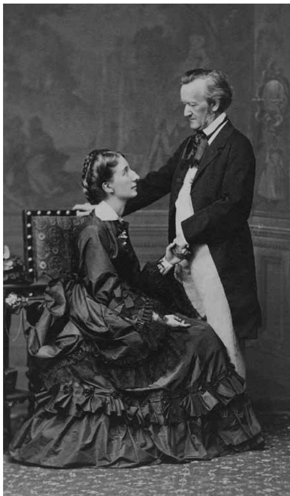
Richard és Cosima Wagner