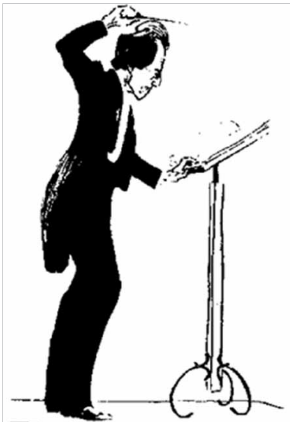
Egy korabeli karikatúrán Mahler vezényel

Bécsi Filharmonikusok vezetőjének is. 1901-ben ismerte meg Alma Schindlert, akivel 1902-ben összeházasodtak.