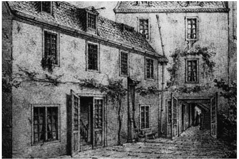
Beethoven szülőháza Bonnban

32 zongoraszonátája közül tizenhetet már a részleges vagy teljes süketség időszakában komponálta. 48 éves korától csak beszélgető