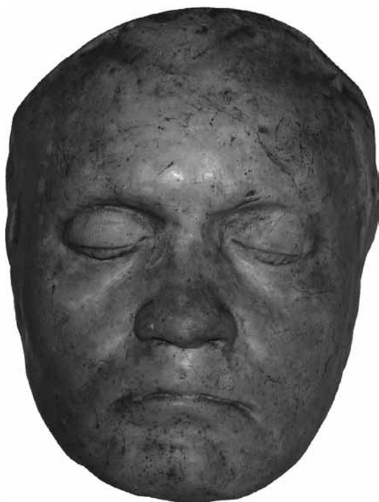
Beethoven halotti maszkja

A szakembereknek többféle elméletük van Beethoven sükettségének kórereditére. Sokáig tartotta magát az otosclerosis elképzelés, de a Paget-kór, a szifilisz, a tífusz, az ólommérgezés, a miliáris tbc(?) és a presbycusis lehetősége is szóba került az idők folyamán. A legalaposabb tanulmányt Gerlinger Imre professzortól olvastam, aki részletesen cáfolja ezeket a lehetőségeket. Véleménye szerint a hozzáférhető adatokból kiolvasható kezdeti tünetek típusos jelei a belső fül eredetű idegi halláscsökkenésnek, amikor a külső szőrsejtek érintettek. Beethoven akkor vált teljesen süketté, amikor már a belső szőrsejtek is tönkrementek. A nem teljesen tisztázott eredetű, progrediáló idegi halláscsökkenés hátterében – tekintetbe véve egyéb feltételezett betegségeit is – autoimmun eredet állhatott.