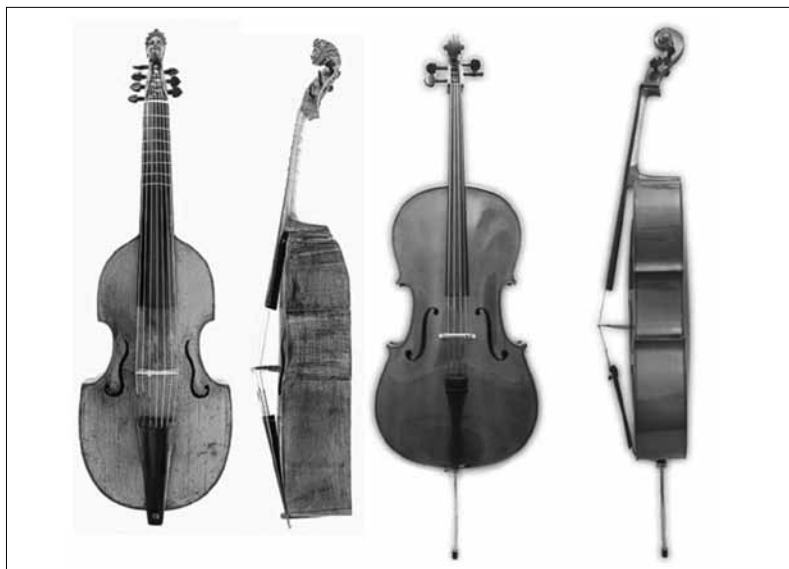
Viola da gamba

1686 és 1725 között öt kötet gamba művet adott ki (Pièces de viole, lásd a Függelékben). Ezeket a műveket szóló, illetve két vagy három gambára írta, számozott basszus kísérettel. Jelentős mértékben gazdagították ezek a művek a hangszer irodalmát, de nem csupán a hangokat találjuk meg a kottában, hanem teljes útmutatót a technikai megvalósításhoz is. Valószínű, hogy pedagógiai célból is készültek. A köteteket még életében kiadták. Marais zenéje kifejezetten