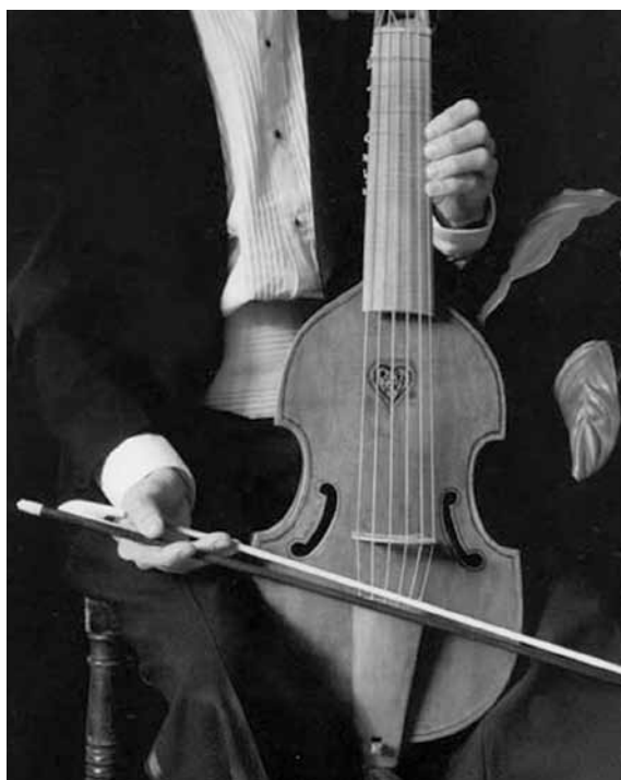
Viola da gamba (térdhegedű)

Feltehető, hogy Celsus inkább az első leírója volt a műtétnek, enciklopédikus munkájában. Felesküdt orvosok ehhez tartották magukat, a műtétet vándor „kőmetszők” végezték, akik apáról fiúra szálló titokként őrizték „művészetük” mesterfogásait. „Kőmetsző” családok ismertek ebből az időből. Voltak olyan királyi paloták, ahol udvari „kőmetszőt” alkalmaztak, annyira gyakori volt a kínzó kór. A „kőmetszés” művészete a hólyagkövek gyors eltávolításából állt. A kövek irtó-