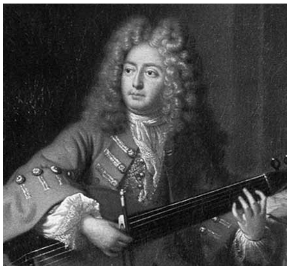
Marin Marais (1656–1728)

A hólyagban képződő kő (gyakran több kő) nagyon súlyos panaszokat okoz. Állandó erős vizelési inger, görcsös vizeletürítés, véres vizelet, vizeletelakadás, vizelési képtelenség gyötrik a beteget. A hólyagkő eltávolítására alkalmazott műtéti eljárást, a gát felől végzett kőmetszést, a perineális lithotomiát, Aulus Cornelius Celsustól (Kr. u 1. évszázad) származtatják ugyan az orvostörténészek, de a kb. 300 évvel előbb élt Hippokratész esküjében már szerepel az a kitétel, hogy „Kőmetszést nem végzek, átengedem az