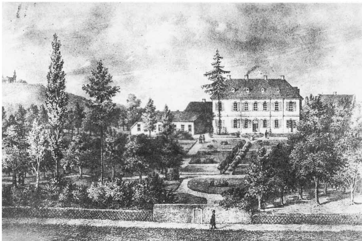
Az idegszanatórium Endenichben

Peters ezek alapján vélekedik úgy, hogy: