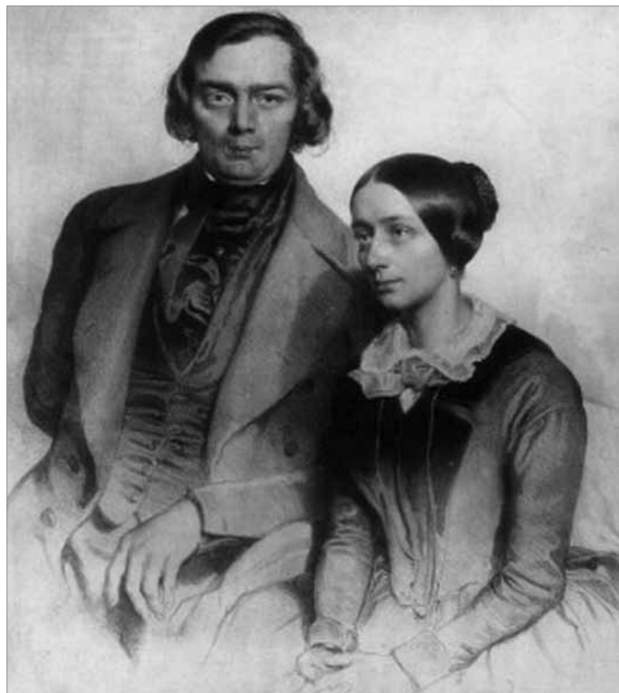
Robert és Clara Schumann

Hat éven keresztül tartó küzdelme leendő feleségéért legendás. Clara Wieck, Schumann zongoratanárának lánya kilenc éves volt, amikor a 18 éves Robert megismerte. Az évek folyamán rajongó szerelem szövődött a két fiatal között. A leány 13 éves korától Európa sok országában ismert zongora virtuóz volt, akit karrierje érdekében apja elzárt szerelmétől, megtiltotta házasságukat. Rejtjeles leveleiket együtt érző barátai közvetítették.