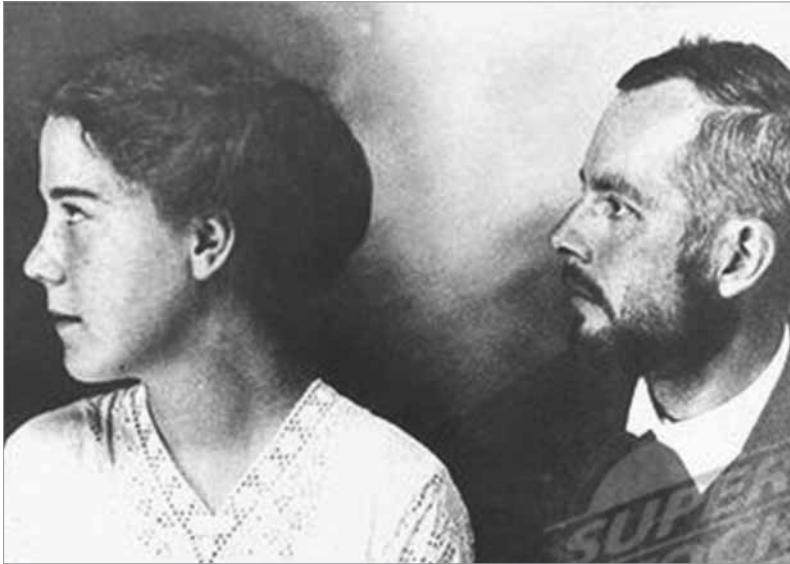
Ziegler Márta és Bartók Béla 1909-ben