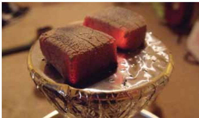
2. ábra: Ízzó faszéndarabok a vízpipa tetején

A másik technológiai innováció, amely a művelt fiatalok körében jelentősen hozzájárult a vízpipázás elterjedéséhez, az az internet volt. Ahogy az internet hozzájárult a vízpipázás gyors megismeréséhez, úgy a vízpipa biznisz résztvevői is gyorsan rájöttek arra, hogy az internet az egyik, ha nem a legjobb eszköz a termékeik megismertetéséhez és eladásához. Az internet jelentős mértékben hozzájárult ahhoz is, hogy a vízpipázás gyorsan átlépte a Közép-Kelet határait. Az egy évtizeddel később megjelenő elektromos cigaretta elterjedésében is rendkívül fontos szerepet játszott az internet.