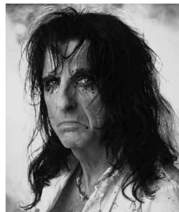
Alice Cooper (1948–)