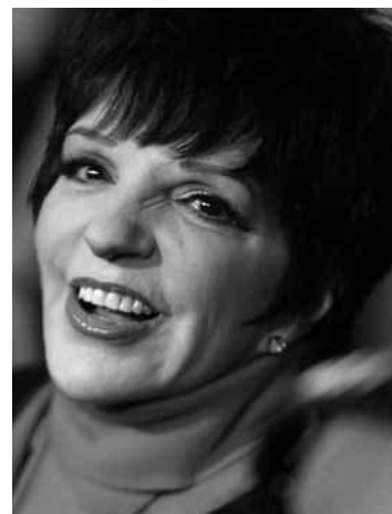
Liza Minnelli (1946–)