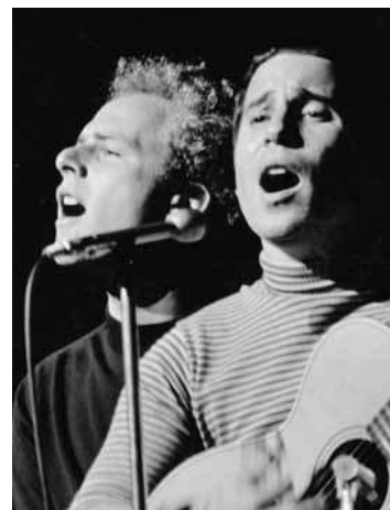
Simon and Garfunkel