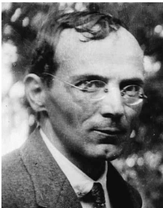
Tóth Árpád (1886–1928)

több mediterrán országot felkeresett, hosszabb időt töltött egy elhagyott kolostorban Mallor- cán, majd kevésbé később Párizsban meghalt.