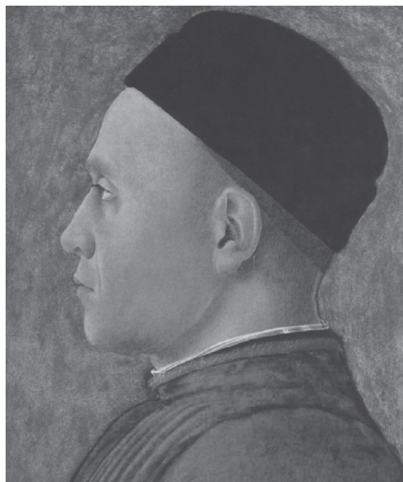
Janus Pannonius (1434–1472)

A 17–19. században bizonyosodtak meg arról, hogy egyes esetekben javulást eredményeznek a „nagy utazások”, főleg Itáliába és Görögországba, és sokan ott kerestek enyhülést vagy gyógyulást a betegségeikre. (Ők az „egészségturizmus” előfutárai.) Skandináviából, Közép-Európából, de