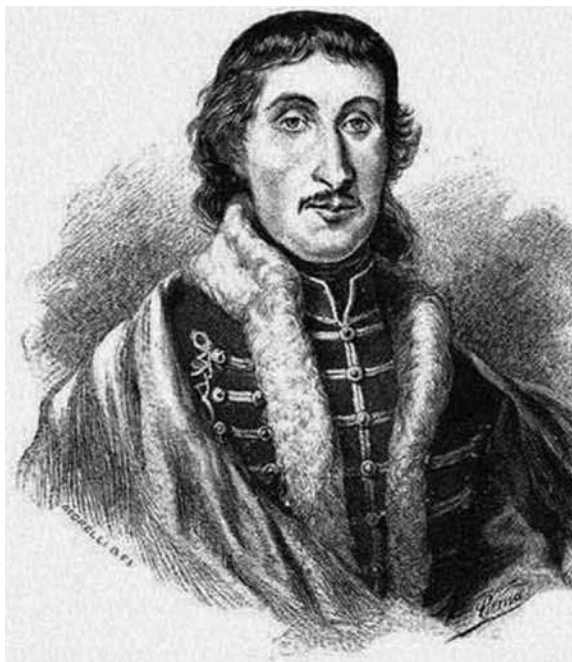
Csokonai Vitéz Mihály (1773–1805)

Nagy-Britanniából is sok tuberkulotikus beteg ke- reste fel ezeket a mediterrán országokat, aminek több következménye lett. Az egyik az volt, hogy a tuberkulózis, amely ezekben az országokban addig ritkán fordult elő, egyre inkább elterjedt. A másik: gyönyörű művek (útleírások, versek, regé- nyek) születtek az átélt élmények, az itáliai táj és emberek hatására. A harmadik: a betegek közül számosan haltak meg ezeken a helyeken, távol hazájuktól, Itáliában vagy más mediterrán orszá- gokban. A „Nápolyt látni és meghalni” szállóige számukra sajátos jelentést kapott.