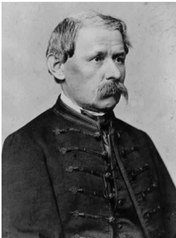
Arany János (1817–1882)

Mi vagyok én? Senki Pál, Egy fájó gép, mely pipál. Tegnap, mint ma Hurut, flegma, Gyilkos asthma, Emphysema, Meg rheuma, Örök téma.