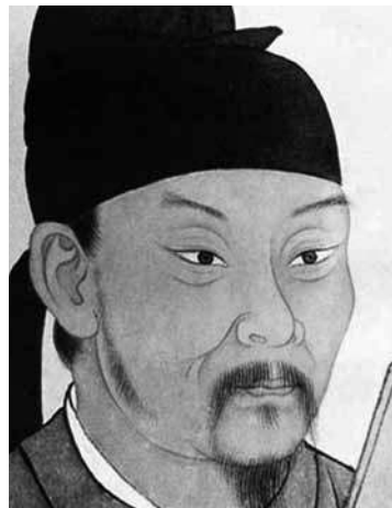
Du Fu (712–770)

5. (d, e) – Blaise Pascal – bár a valószínűségszámítás alapjait neki köszönhetjük – és Cardano, nem illik a sorba. Cardano ugyan írt a kártyajáté-