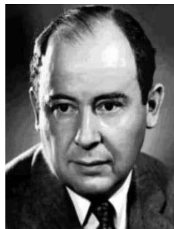
Neumann János (1903–1957)

3. (d) – A gázmaszkos megoldás a helyes, bár semmivel sem bizarrabb, mint bármelyik másik verzió. (Forrás – Grey, C: A britek kódfejtő gépezete. History 2012; 2[7]: 24-26.)