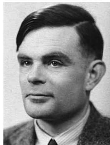
Alan Turing (1912–1954)

A költőről ránkmaradt korabeli leírásokból kitűnő asztmáról nemigen lehet eldönteni, hogy az tüdőasztma, vagy a pár generációval korábban még élt, mára kihalt szívasztma volt-e. Az is meglehet, hogy jelentős túlsúlya miatt pihegett csupán. Mindazonáltal poémáiból nem hiányoznak az asztal örömei és különösen a jőféle szeszek, leginkább borocskák. A vers alapján bizonyos, hogy virágpor allergiáról nem lehetett szó. A források arról is szólnak, hogy poétánk nem csak a bor barátja, a politikai viszonyok ostorozója, de keresztény is volt, ami a buddhizmus hazájában és különösen abban a korban legalábbis különös.