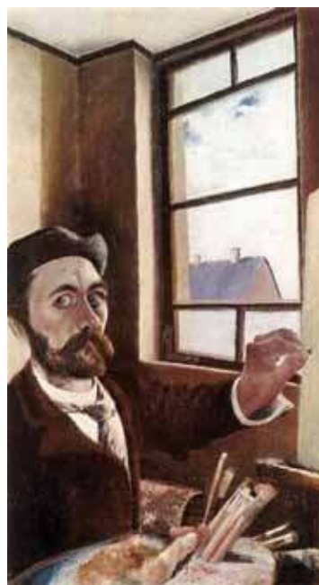
Csontváry Kosztká Tivadar (1853–1919)

A prognózis még a diagnózisnál is nehezebb feladat. Hiába van ott mindkét szóban a gnózis: a tudás – ingoványos talajon jár-kelel a doktor. Ó, az apró jelek megfigyelése..., mint itt is (az idézet a könyv 469. oldaláról származik).