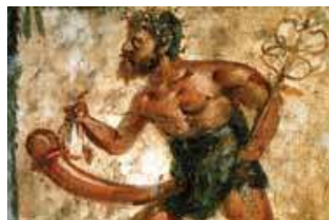
Priaposz ábrázolás egy pompei freskón

Két élő patkányt látott, amint bementek a házba, az utcai kapun át. Szomszédok újságolták neki, hogy náluk is megjelentek újra az állatok. A gerendák közt ismét hallani lehetett a hónapok óta elfelejtett zajt. Rieux várta az összesített statisztika megjelenését, mely minden hét elején volt esedékes. Megtudta belőle, hogy a betegség hátrál.”